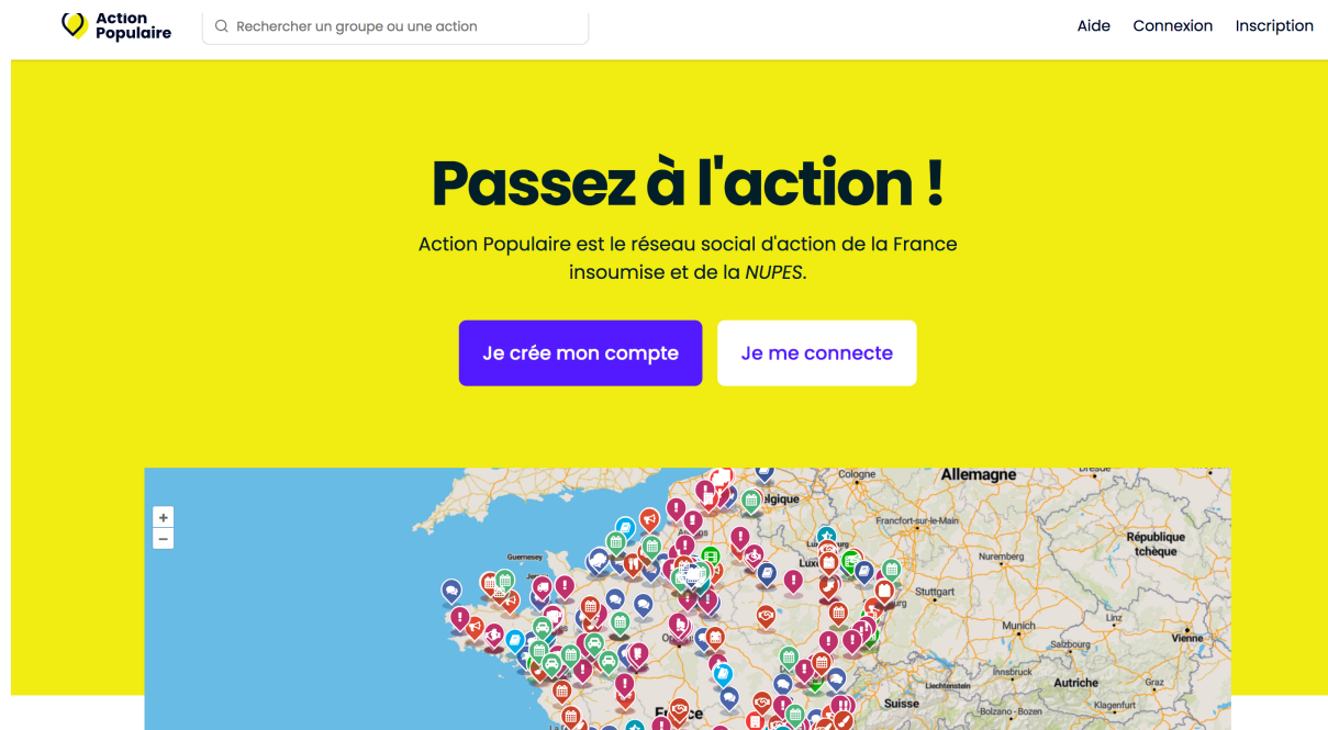
Figure 1 - Capture d'écran de la page d'accueil de la plateforme Action populaire.

plus grand nombre. Les codes couleurs classiques des partis politiques de gauche – comme le rouge - ne sont pas utilisés. En revanche, le jaune fluo est mis à l'honneur, comme un appel à ceux qui ont soutenu ou ont fait partie des gilets jaunes. L'objectif est d'attirer l'attention, l'œil de l'internaute avec des couleurs flashy qui sont aussi des références d'action collective et de colère populaire.