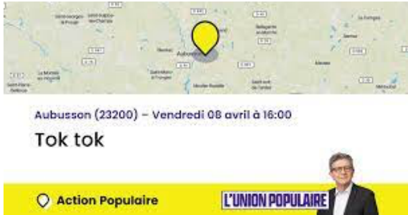
Figure 2- Capture d'écran d'une action de porte-à-porte (TokTok) annoncée sur Action Populaire 21

Il pouvait y avoir au sein des groupes des personnes qui ne se sont jamais rendues aux actions sur le terrain, qui ne répondaient pas aux mails, mais qui pouvaient être informées de toutes les propositions du groupe. Ces derniers étaient alors au courant des opérations de collage et pouvaient facilement aller décroquer ensuite.