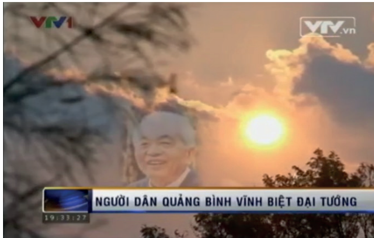
Le général dans le cœur des habitants de Quảng Bình (13 octobre 2013).

En premier lieu, le média a retransmis les cérémonies commémoratives qui se déroulent simultanément dans plusieurs endroits différents (provinces, casernes militaires, ambassades du Vietnam dans plusieurs pays du monde) et auxquelles assistent les militaires, les Việt kiều (Vietnamiens de l'étranger), les universitaires ou les admirateurs du général, et en particulier les habitants de la province de Quảng Bình, sa terre natale :