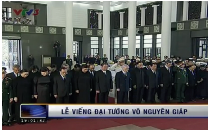
Espace politique (12 octobre 2013).

L'espace sacré est attribué au monde protocolaire et officiel du politique : avant d'appartenir à sa famille et son peuple, VNG est l'homme du PCV. Lors des condoléances devant le cercueil du défunt (le 12 octobre 2013), la manifestation visible de cette prérogative est la place privilégiée accordée aux dignitaires politiques vietnamiens ainsi qu'aux délégations de dirigeants étrangers.