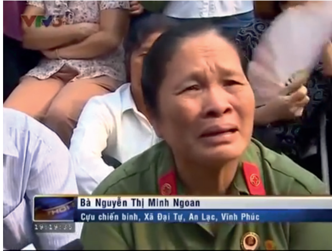
La femme vétéran exprime sa douleur (12 octobre 2013).

Les mots exprimant la douleur et l'admiration du peuple abondent dans les récits médiatiques. Dans la citation suivante : « Nous l' aimions beaucoup [pleurs], nous sommes très émus, nous peinons à nous retenir, tous les Hanoïens avaient de la compassion pour l'Oncle Giáp » (13 octobre 2013), le verbe « aimer », littéralement en vietnamien thương , désigne un sentiment confus d'amour, de pitié et de compassion. Pour le général Giáp, ce mot peut être interprété dans un sens qui renvoie à l'abandon dont il aurait été victime de la part du pouvoir vers la fin de sa carrière.