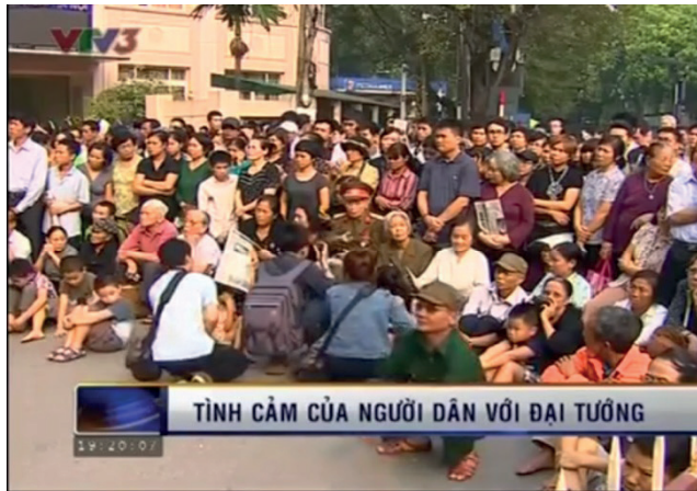
Espace profane, 12 octobre 2013.

L'espace profane est attribué à l'expression populaire envers le général défunt. Défini d'emblée comme espace éloigné du sacré (la foule dans la rue ou le cercle extérieur du lieu officiel de la cérémonie), le média fait émerger progressivement l'émotion intense des personnes ordinaires dans les espaces publics disparates. On assiste à un vécu qui témoigne d'un double registre de la communion : celle qui relie les gens entre eux et celle qui les relie à l'âme du général défunt. Ce qui frappe dans les images captées, c'est la patience, la sincérité et la douleur qui associent les uns aux autres : les gens se sentent proches et solidaires dans le partage du chagrin.