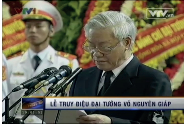
Le secrétaire général du PCV (13 octobre 2013).

La description médiatique cherche en permanence à entremêler le pouvoir politique et le sacré. Elle assimile le discours et l'acte des dirigeants politiques aux protocoles cérémoniels codifiés par les marqueurs culturels comme le cercueil sacré , les fleurs, les offrandes, la cloche bouddhiste, les turbans des proches (de couleurs différentes selon leur degré de parenté avec le défunt), les fils du défunt portant les pots d'encens selon les coutumes traditionnelles, le char sacré , etc. Alors que le JT a donné très peu d'image à la famille du défunt (instance légitime pour assurer la tenue de la cérémonie funéraire selon la tradition vietnamienne), celle des dirigeants politiques auprès du cercueil (manifestation tangible du sacré) est omniprésente.