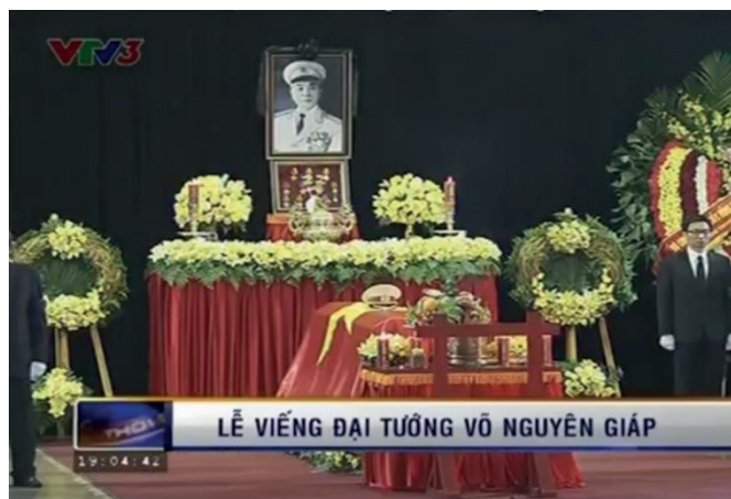
Le cercueil sacré (12 octobre 2013).

La description médiatique cherche en permanence à entremêler le pouvoir politique et le sacré. Elle assimile le discours et l'acte des dirigeants politiques aux protocoles cérémoniels codifiés par les marqueurs culturels comme le cercueil sacré , les fleurs, les offrandes, la cloche bouddhiste, les turbans des proches (de couleurs différentes selon leur degré de parenté avec le défunt), les fils du défunt portant les pots d'encens selon les coutumes traditionnelles, le char sacré , etc. Alors que le JT a donné très peu d'image à la famille du défunt (instance légitime pour assurer la tenue de la cérémonie funéraire selon la tradition vietnamienne), celle des dirigeants politiques auprès du cercueil (manifestation tangible du sacré) est omniprésente.