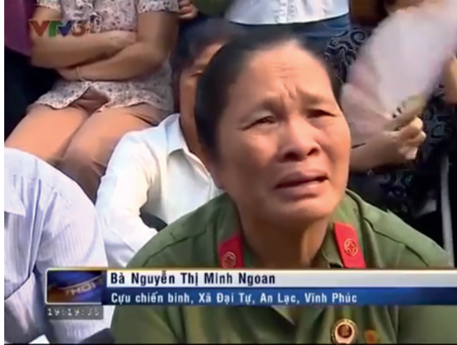
La femme vétéran exprime sa douleur (12 octobre 2013).

Les mots exprimant la douleur et l'admiration du peuple abondent dans les récits médiatiques. Dans la citation suivante : « Nous l' aimions beaucoup [pleurs], nous sommes très émus, nous peinons à nous retenir, tous les Hanoïens avaient de la compassion pour l'Oncle Giáp » (13 octobre 2013), le verbe « aimer », littéralement en vietnamien thương , désigne un sentiment confus d'amour, de pitié et de compassion. Pour le général Giáp, ce mot peut être interprété dans un sens qui renvoie à l'abandon dont il aurait été victime de la part du pouvoir vers la fin de sa carrière.