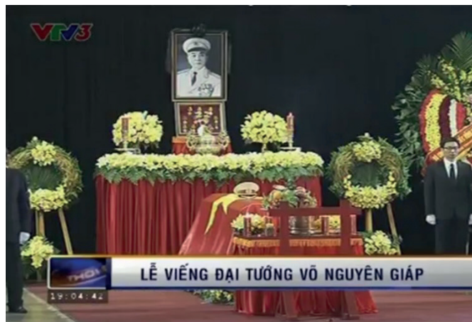
Le cercueil sacré (12 octobre 2013).

La description médiatique cherche en permanence à entremêler le pouvoir politique et le sacré. Elle assimile le discours et l'acte des dirigeants politiques aux protocoles cérémoniels codifiés par les marqueurs culturels comme le cercueil sacré , les fleurs, les offrandes, la cloche bouddhiste, les turbans des proches (de couleurs différentes selon leur degré de parenté avec le défunt), les fils du défunt portant les pots d'encens selon les coutumes traditionnelles, le char sacré , etc. Alors que le JT a donné très peu d'image à la famille du défunt (instance légitime pour assurer la tenue de la cérémonie funéraire selon la tradition vietnamienne), celle des dirigeants politiques auprès du cercueil (manifestation tangible du sacré) est omniprésente.